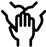
Confiança i transparència